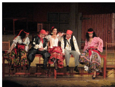
Scenă din spectacol

Dirijorul Vlad Conta a condus cu bună integrare stilistică și mână sigură, dovedind că succesul de la Opera de Stat din Hamburg unde a dirijat „Carmen” în trecuta stagiune nu a fost deloc întâmplător. Corul mare și Corul de copii au fost ca de obicei în bună formă. Orchestra a cântat omogen și sunt convins că l-ar fi mulțumit pe de-a-ntregul pe șeful ei, dacă nu ar fi fost câteva accidente la corn în timpul ariei Micaëlei sau pe finalul actului al III-lea. După cum, s-au adăugat câteva replici nesigure ale contrabandiștilor către sfârșitul celui de-al doilea act.